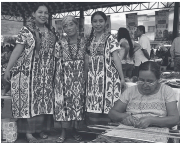
Figura 2 Huipiles para mujeres