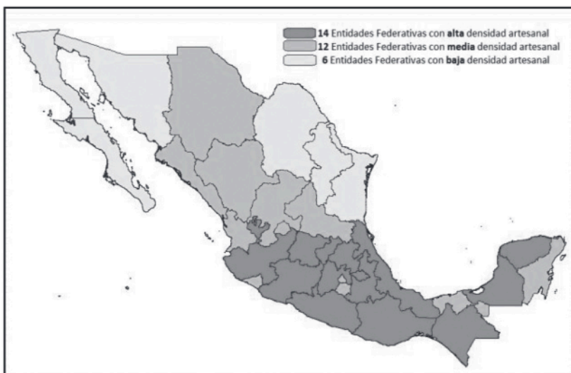
Figura 3 Densidad de la población artesanal en México

registrados por la FONART (2018), se estima que actualmente doce millones de mexicanos se dedican a esta actividad y que catorce de los 32 estados del país se clasifican por su alta densidad de actividad artesanal; dentro de ellos se encuentra Oaxaca, estado donde nos centramos en este trabajo (figura 3). Si bien se reconoce que estas cifras no son actuales, no dejan de reflejar lo importante de la actividad artesanal para millones de familias de estratos socioeconómicos bajos, sobre todo las que habitan en poblaciones rurales e indígenas, y que esta actividad representa una alternativa de gran valor para obtener recursos monetarios que les permitan sufragar sus gastos para satisfacer sus necesidades básicas, frente al abandono de las actividades agrícolas y del problema del desempleo, tal como ocurre en muchas comunidades del estado de Oaxaca (Peralta, 2011; Lugo, Ramírez, Navarro y Estrella, 2008).