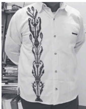
Figura 1 Camisa para caballero