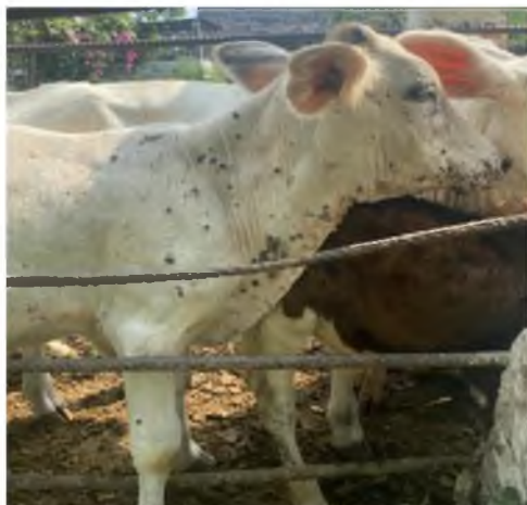
Figura 9. Papiloma en el cuello.

Los papilomas epiteliales fueron identificados en diferentes partes de cada animal; cabeza, quijada, punta de codo, pecho, testículos, papada, cuello, pene y glándulas mamarias (figura 7, figura 8 y figura 9), sin embargo, existen reportes que es posible que se pueda localizar en otras regiones como en la cola y en los cuartos delanteros y traseros (Monteiro et al. , 2010), no se identificaron verrugas en las partes internas de los animales debido a que no se sacrificó ningún animal. Nuestro interés se enfocó en papilomas epiteliales por el rápido desarrollo de estos, al no tener la sanidad adecuada pueden llegar a desarrollar tumores malignos (Rojas et al. , 2016).