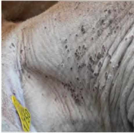
Figura 12. Papiloma en forma de grano de arroz.