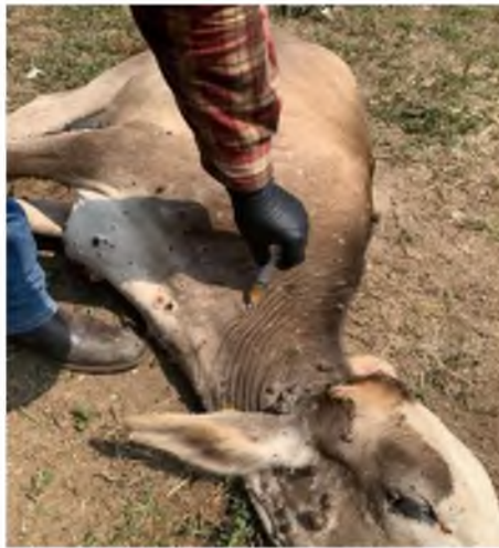
Figura 8. Aplicación de la vacuna.

Se monitoreó a los animales durante todo el periodo de vacunación, para poder descartar reacciones que puedan perjudicar la vacuna o en su caso descartar intoxicaciones.