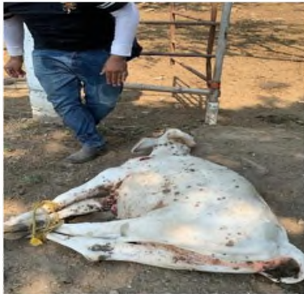
Figura 17. Becerro 90 días posvacunación.