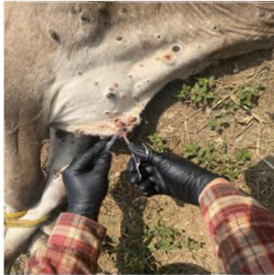
Figura 2. Recolección de muestra de papiloma.