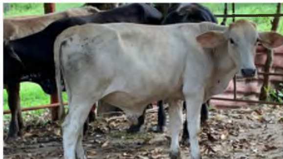
Figura 18. Becerro en día 90 después de la vacuna.