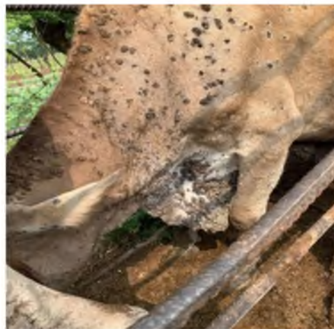
Figura 14. Papiloma en forma pedunculada.