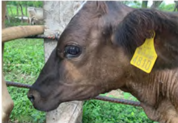
Figura 16. Becerra día 30 posvacuna, dos aplicaciones.