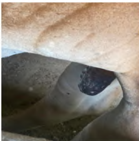
Figura 11. BPV en testículos.

En el Cuadro 1 se muestran los diferentes tipos de papilomas encontrados en las UP de acuerdo con el número de animales identificados. Donde se observa que el papiloma con forma de grano de arroz se encuentra en mayor proporción en la región. Hay ranchos en los que solo se encontró un tipo de papiloma ya que de igual manera el número de animales en esas unidades fue menor.