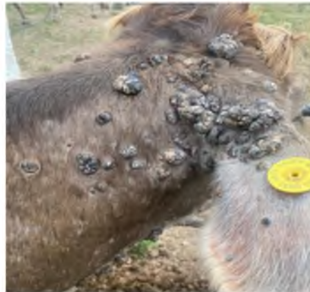
Figura 13. Papiloma en forma de coliflor.