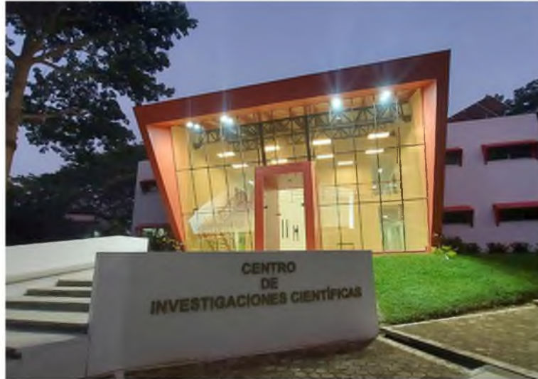
Figura 1. Centro de Investigaciones Científicas.