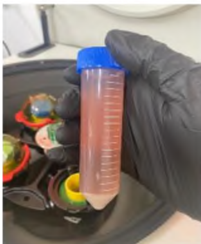
Figura 6. Muestra centrifugada.

Cada proceso de elaboración de todo el producto consistió en 300 g de material del papiloma, mezclado con 200 mL de agua desionizada para su trituración. Posteriormente a esa mezcla se le agregó 100 mL de formol al 7.5%, 100 mL de oxitetraciclina y 100 mL de ácido yatrénico más caseína (figura 7).