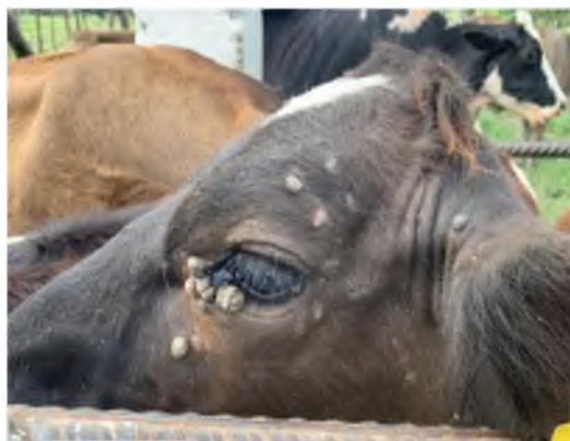
Figura 10. Papiloma alrededor de los ojos.