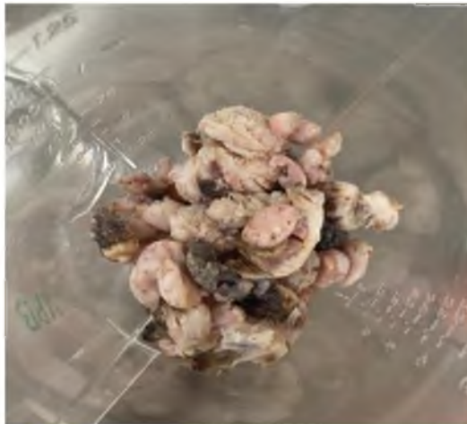
Figura 3. Papiloma después de lavarlo.