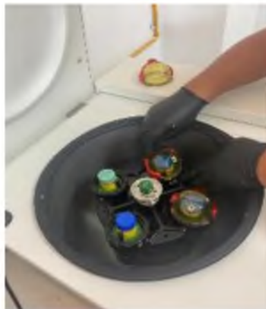
Figura 5. Separación del solida del líquido.

El manejo de las vacunas es siempre mantenerlas cubiertas de la luz y mantenerlas a temperaturas bajas de refrigeración o en hielo según su manejo, transporte y aplicación.