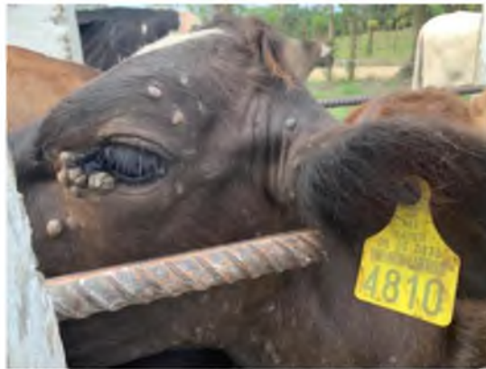
Figura 15. Becerra día 0 de aplicación.