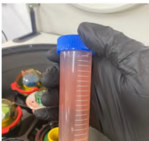
Figura 7. Vacuna lista para refrigerarse.

Cada proceso de elaboración de todo el producto consistió en 300 g de material del papiloma, mezclado con 200 mL de agua desionizada para su trituración. Posteriormente a esa mezcla se le agregó 100 mL de formol al 7.5%, 100 mL de oxitetraciclina y 100 mL de ácido yatrénico más caseína (figura 7).