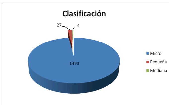
Figura 2. Clasificación de MiPYMES

Finalmente se identificó el tipo de negocio en donde como se observa en la Figura 3 los resultados fueron los siguientes: