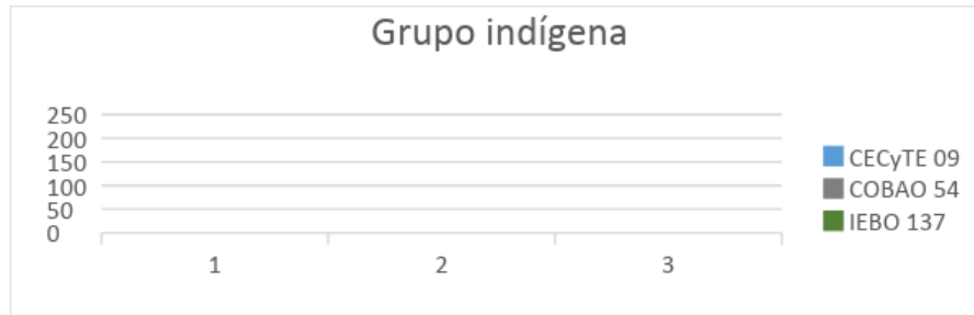
Gráfica 4. Grupo indígena al que pertenecen los estudiantes de las EMS estudiadas.

En la gráfica 4, se observa que aproximadamente el 30% de la población estudiantil pertenece a un grupo indígena, de los cuales sobresale el chinanteco, en los tres institutos encuestados.