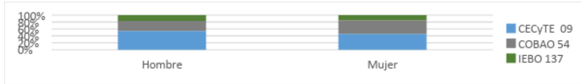
Gráfica 2. Género de la matrícula de las EMS estudiadas.

En la gráfica 2, se muestran los alumnos por sexo de acuerdo a los datos arrojados por la encuesta, donde el 51% de la población estudiada son mujeres y el resto hombres, por institución el CECYTEO 09 se compone de 53% hombres y un 47% de mujeres, en el caso del COBAO 54, solo el 41% corresponde al género masculino y con el 59% sobresale el género femenino, mientras el IEBO 52% y 48% hombres y mujeres respectivamente.