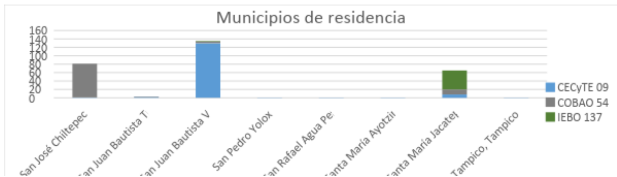
Gráfica 3. Municipios donde residen los estudiantes de las EMS estudiadas.

Los tres municipios principales son: Valle Nacional, donde se localiza el CECyTE 09, con 135 alumnos que residen en él, le secunda San José Chiltepec, aquí se ubica el COBAO 54 con 81 alumnos pertenecientes, y con 65 alumnos lugareños de Santa María Jacatepec, donde encontramos el IEBO 137.